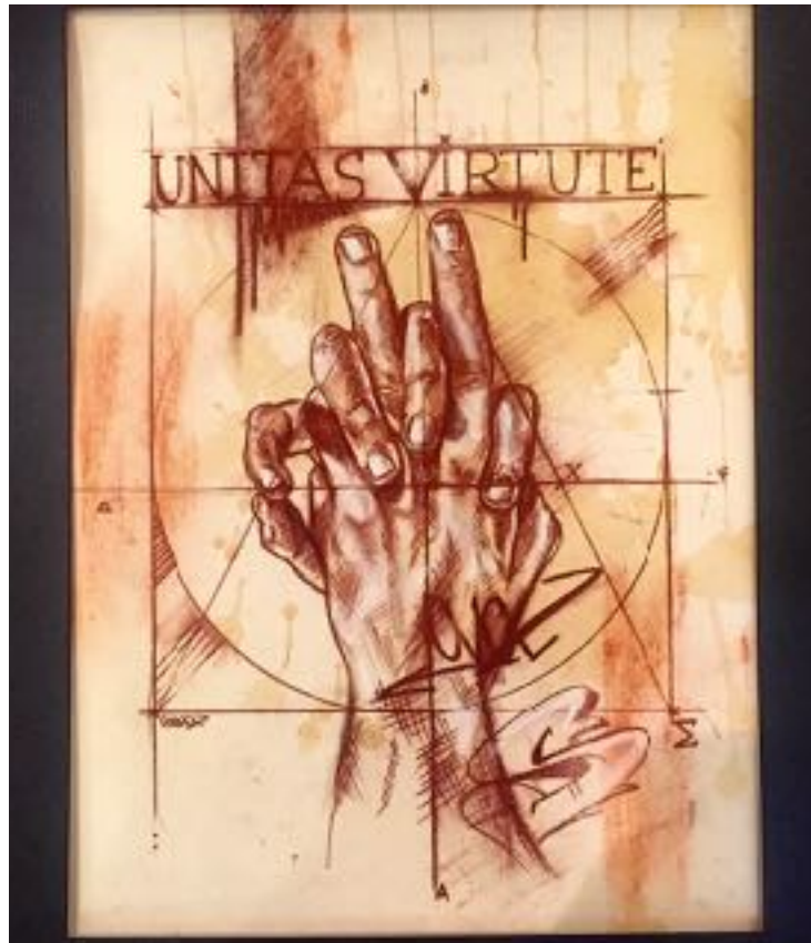
WHEN GRAFFITI MEETS DA VINCI (SANGUINE)