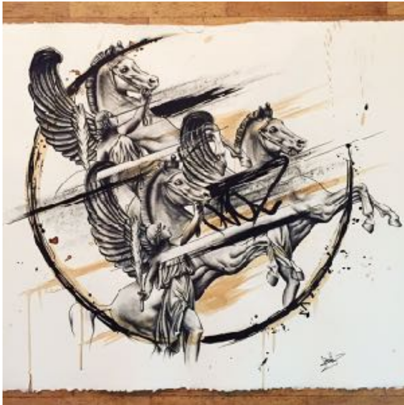
BLACK PEGASUS (FUSAIN ET PIERRE NOIRE)