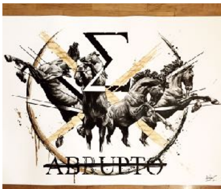
EX ABRUPTO INSPIRED BY THE « HORSES OF HELIOS » (FUSAIN)