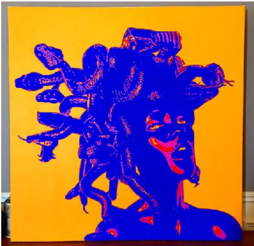
MEDUSA (ACRYLIQUE )