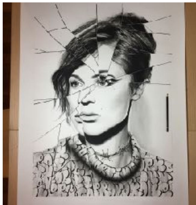
FRAGILE (DESSIN AU FUSAIN ET CRAYON DE PAPIER)