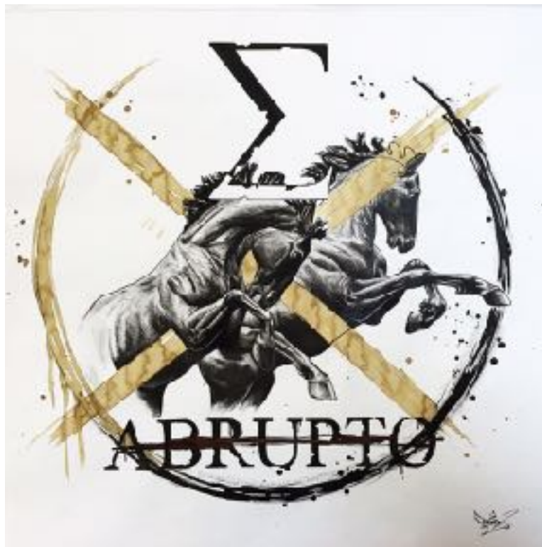
HORSES OF HELIOS (FUSAIN ET PIERRE NOIRE)