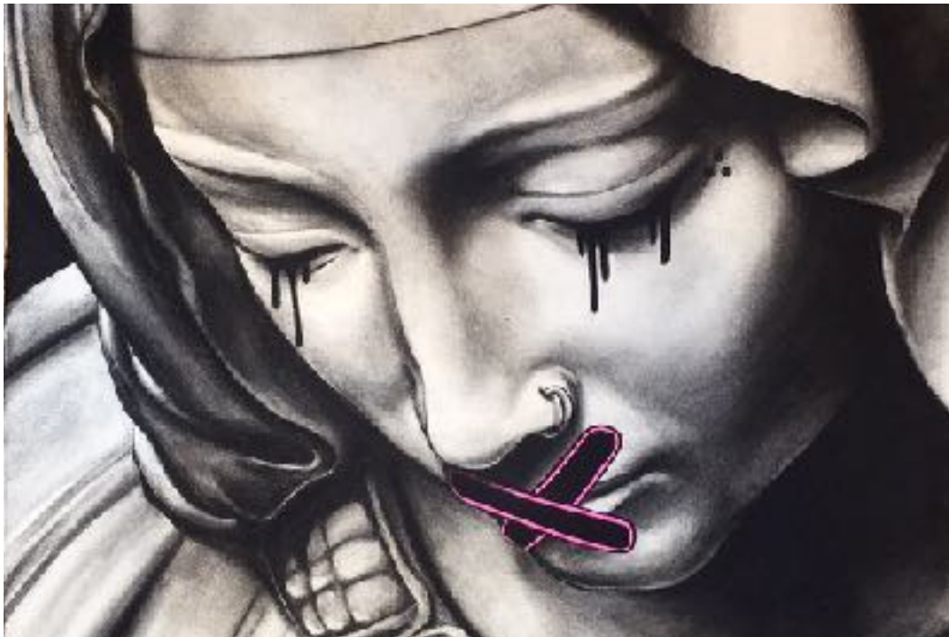
LA PIETASSE (FUSAIN, PIERRE NOIRE ET ACRYLIQUE)