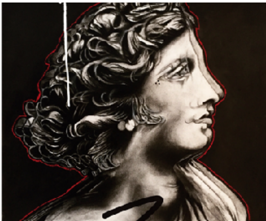
APOLLO (PIERRE NOIRE, PASTEL, ACRYLIQUE)