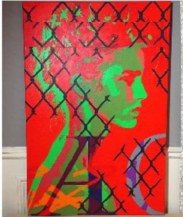
UNREACHABLE (ACRYLIQUE, BOMBES AÉROSOLS)